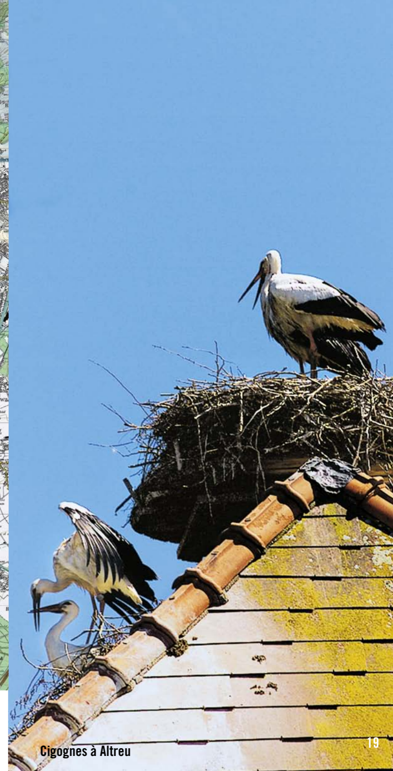
Cigognes à Altreu

Départ Startpunkt Start Arrivée Ankunfts Arrival Plage Badestrand Beach Parcours de base Basis-Strecke Basic route