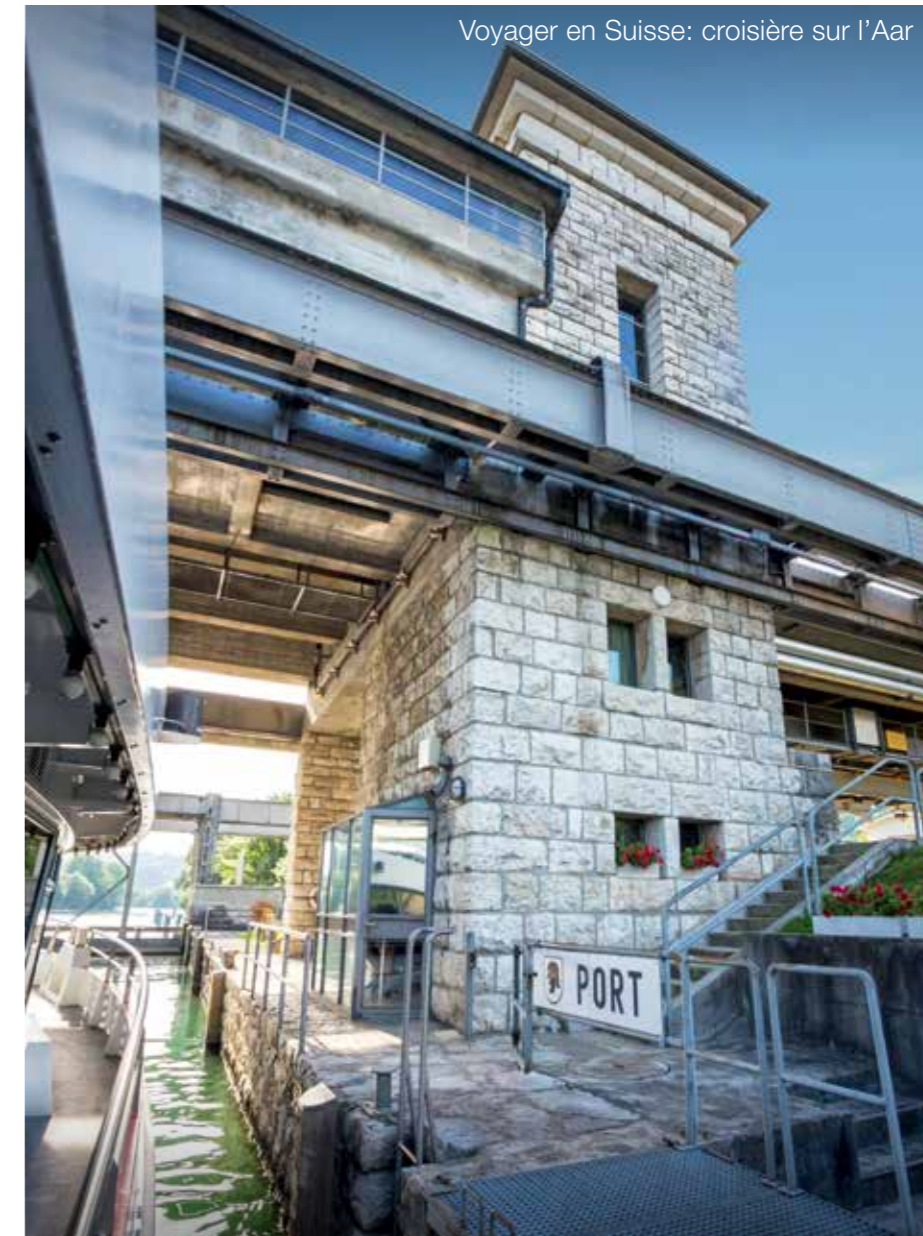
Le barrage de régulation de Port, dispositif clé de la deuxième correction des eaux du Jura. L'ouvrage régule le niveau des trois lacs du pied du Jura et le débit de l'Aar.