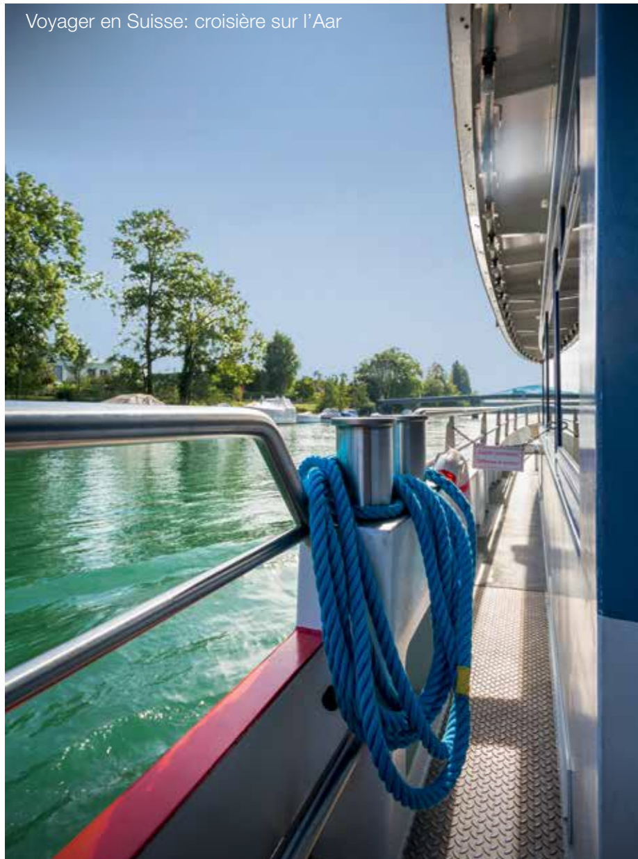
Une promenade tranquille sur l'Aar à bord du MS Rousseau, de Bienne à Soleure.

«Petit, j'allais pêcher au bord de l'Aar avec mes copains. Aujourd'hui, l'Aar est devenue mon lieu de travail et le centre de ma vie.»