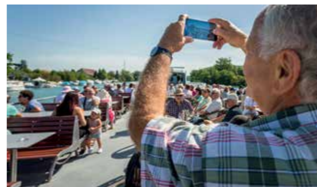
Avec cette météo de rêve, le Seeland se présente sous son plus beau jour.

Les deux corrections des eaux du Jura, dans les années 1870 et 1960, ont nettement amélioré la situation. Depuis, le niveau de l'Aar est contrôlé par les canaux de Hagneck et de Nidau-Büren, celui de chacun des trois lacs est ajusté par le barrage de régulation de Port et son écluse. Nous passons justement cette dernière au bout d'un quart d'heure de navigation. Thomas fouille dans sa poche à la recherche de son portable, et vérifie le niveau de l'eau sur une appli. Les portes s'ouvrent, l'eau s'écoule en écumant. Le niveau baisse de 2 mètres. Malgré les importants travaux réalisés, le Seeland n'est jamais à l'abri des crues et des inondations. Notre guide en a fait l'expérience. Son front se plisse quand il raconte que tous les ans ou presque, les bateaux restent amarrés plusieurs jours. Le manque à gagner est compensé par le nombre croissant de passagers. La compagnie BSG transporte chaque année